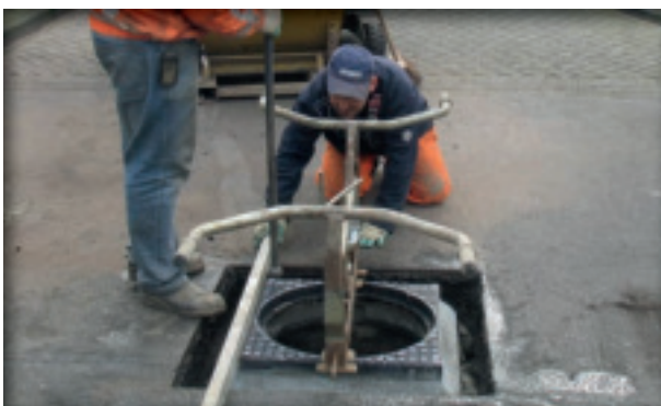
3. Stellen putrand