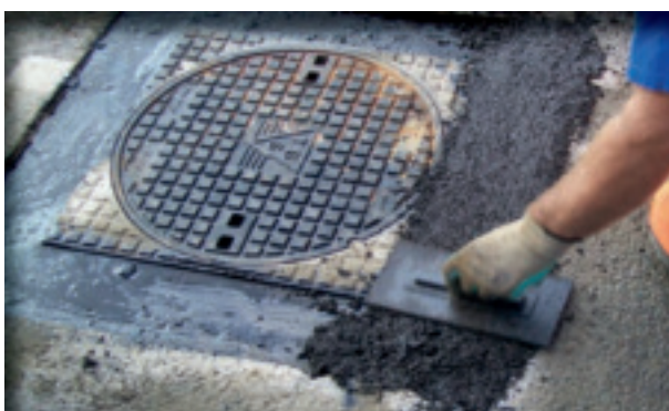
5. Kleeflaag en VB Asfaltbeton aanbrengen