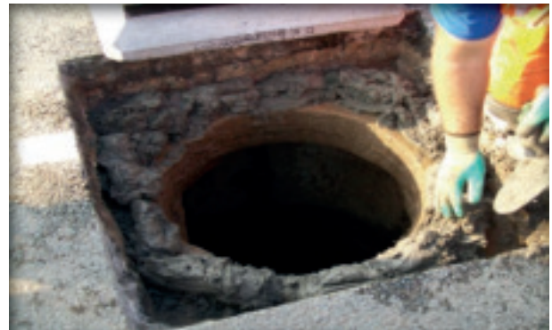
2. Aanbrengen stelmortel