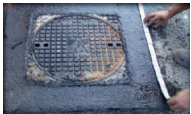
6. Afwerking met bitumenband