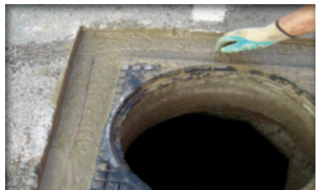
4. Aanbrengen gewapende betonwegenmortel