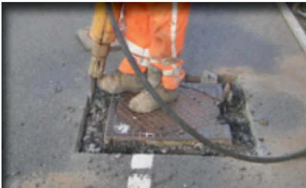
1. Verwijderen putrand